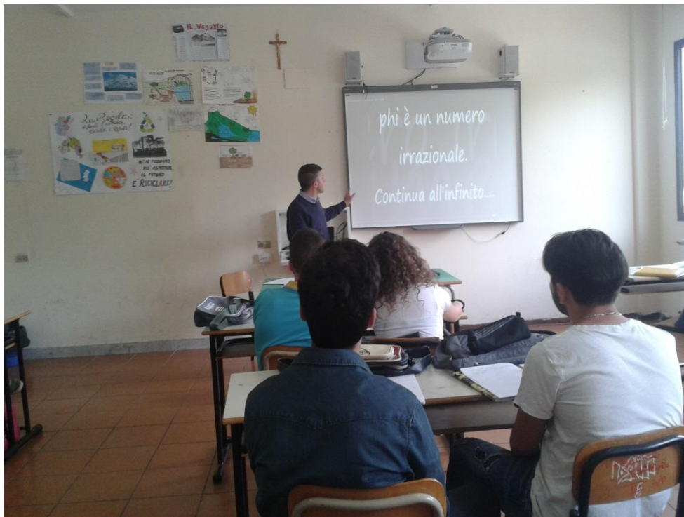
Proiezione filmato sulla sezione aurea per coinvolgimento classe nell'argomento